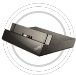
Station d'accueil pour ThinkPad® Tablet