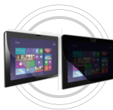
Filtre antireflets et de confidentialité