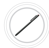
Styler numérique ThinkPad®

Accessoire recommandé – reliez votre portable à sa station d'accueil et alimentez-le avec un câble unique.