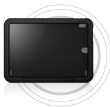
Étui de protection pour ThinkPad® Helix