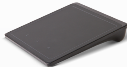
Pavé tactile sans fil Lenovo®