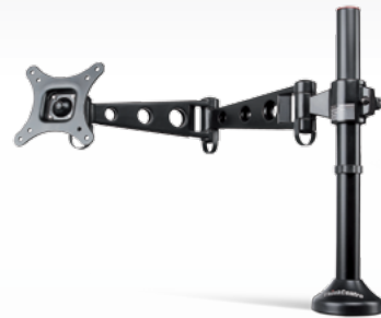
Bras extensible pour ThinkCentre®