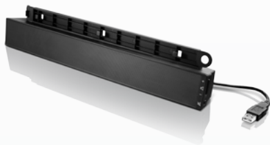
Barre multimédia USB Lenovo®