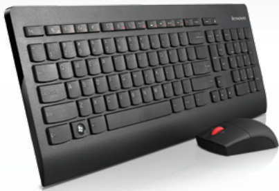
Clavier et souris sans fil ultrafins Lenovo®